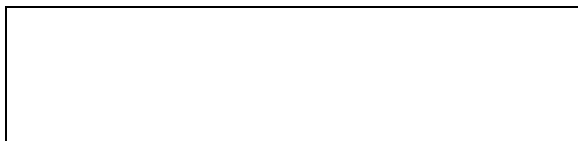
Marcel Broodthaers. Musée d'Art Moderne Département des Aigles, Section XIXe siècle (bis) . Vista parcial de la instalación.

El Musée d'Art Moderne, Département des Aigles , ideado por Marcel Broodthaers en 1968 era en realidad un museo ficticio 30 , compuesto de cajas de embalaje de obras de arte, de tarjetas postales de cuadros del s.XIX y de diversas inscripciones sobre ellas 31 . Suponía la derivación de La Boite-en-Valise de Duchamp y de las proposiciones de artistas creadores de "micromuseos" como las cajas-museo de Joseph Cornell de mediados y finales de los cuarenta, o de las ficciones del Store de Claes Oldenburg de 1961 que pasó luego a ser el Mouse Museum 32 . La presencia de reproducciones de obras de arte guardaba una estrecha relación con el "museo sin paredes" de Malraux, referido a todas aquellas obras de arte que pueden ser sometidas a una reproducción mecánica y, por tanto, de la práctica discursiva que la reproducción mecánica ha hecho posible: la historia del arte. También con algunas de las propuestas más perversas de Merleau-Ponty, quien llegó a comisariar una exposición de reproducciones de obras de algunos de los autores que más apreciaba como una irónica crítica al estamento artístico institucional 33 .