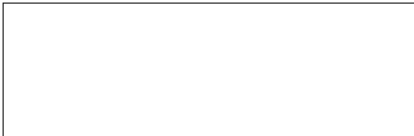
Daniel Buren, Photo-Souvenir: "A partir de là" . Intervención en el Städtisches Museum, Mönchengladbach, Alemania.

expuestas habitualmente, a otra sala, copia exacta de aquélla, donde se colocaron en el mismo orden en el que estaban dispuestas en su ubicación anterior. Las paredes vacías de la sala 8 del Museo fueron cubiertas totalmente por unas bandas de color verticales, excepto los espacios que ocupaban originariamente las obras de De Chirico. Unas etiquetas informativas indicaban qué pinturas habían sido trasladadas y a dónde, así como el tiempo que iban a estar en su nueva ubicación. Una reinstalación, por tanto, que incidía en el carácter permanente de estas obras como imprescindibles representantes de la colección del museo, así como en su carácter móvil como objetos. Ser desplazadas y reinstaladas, dentro de su propio contexto o en otros históricamente diferentes, como el propio Buren afirma, se acepta como parte de su destino como pinturas. Esta intervención provoca una crisis en la siempre aparente neutralidad del espacio expositivo, evidenciando la compleja relación entre los objetos y el lugar, entre el arte y la institución expositiva.